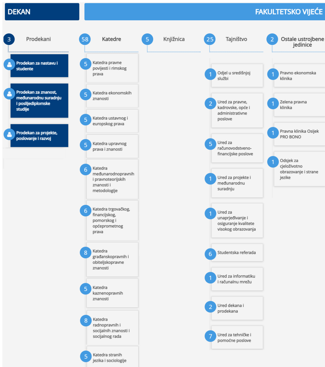
Slika 1. Organizacijska struktura Pravnog fakulteta Osijek